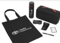
Zestaw prezentowy Professional Gadżety