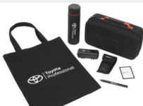
Zestaw prezentowy Professional Gadżety