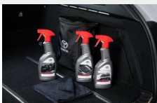
Zestaw kosmetyków samochodowych Toyoty Kosmetyki