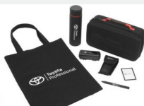
Zestaw prezentowy Professional Gadżety