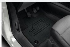
Dywaniki gumowe przednie EV Dywaniki / Wykładziny