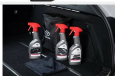
Zestaw kosmetyków samochodowych Toyota Kosmetyki