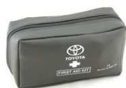
Apteczka DIN13164 APTECZKI/Bezpieczeństwo