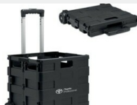
Skrzynka bagażowa Gadżety