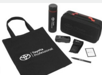
Zestaw prezentowy Professional Gadżety