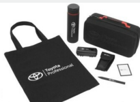
Zestaw prezentowy Professional Gadżety