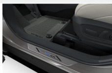
Dywaniki gumowe Dywaniki / Wykładziny

Toyota bZ4X - Elektryczny JTMAABAA90A036767