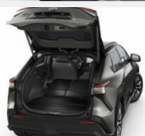
Wykładzina bagażnika Dywaniki / Wykładziny