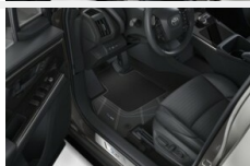
Dywaniki welurowe - premium Dywaniki / Wykładziny