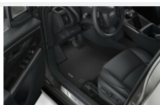
Dywaniki welurowe Dywaniki / Wykładziny