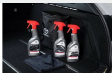
Zestaw kosmetyków samochodowych Toyoty Kosmetyki