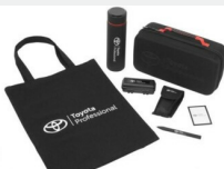
Zestaw prezentowy Professional Gadżety