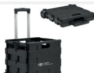
Skrzynka bagażowa Gadżety