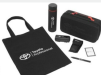
Zestaw prezentowy Professional Gadżety