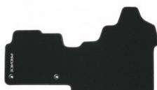
Dywaniki tekstylne (czarne) Dywaniki / Wykładziny