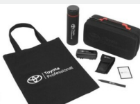
Zestaw prezentowy Professional Gadżety