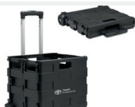
Skrzynka bagażowa Gadżety