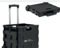
Skrzynka bagażowa Gadżety

Toyota Hilux 2.4 Diesel AHTBB3CD601791490