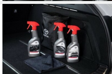
Zestaw kosmetyków samochodowych Toyota Kosmetyki