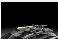
Uchwyt na narty/snowboard Bagaż