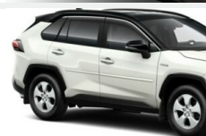
Owiewki szyb bocznych Nadwozie