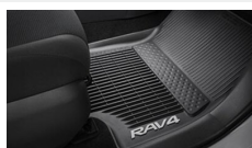
Dywaniki gumowe (czarne) Dywaniki / Wykładziny