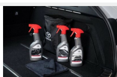
Zestaw kosmetyków samochodowych Toyota Kosmetyki