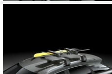
Uchwyt na narty/snowboard Bagaż