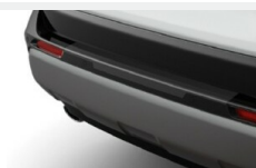
Folia ochronna na zderzak tylny Nadwozie