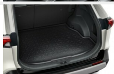
Wykładzina bagażnika Dywaniki / Wykładziny