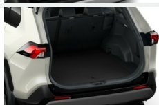
Wykładzina ochronna tylnych siedzeń Dywaniki / Wykładziny